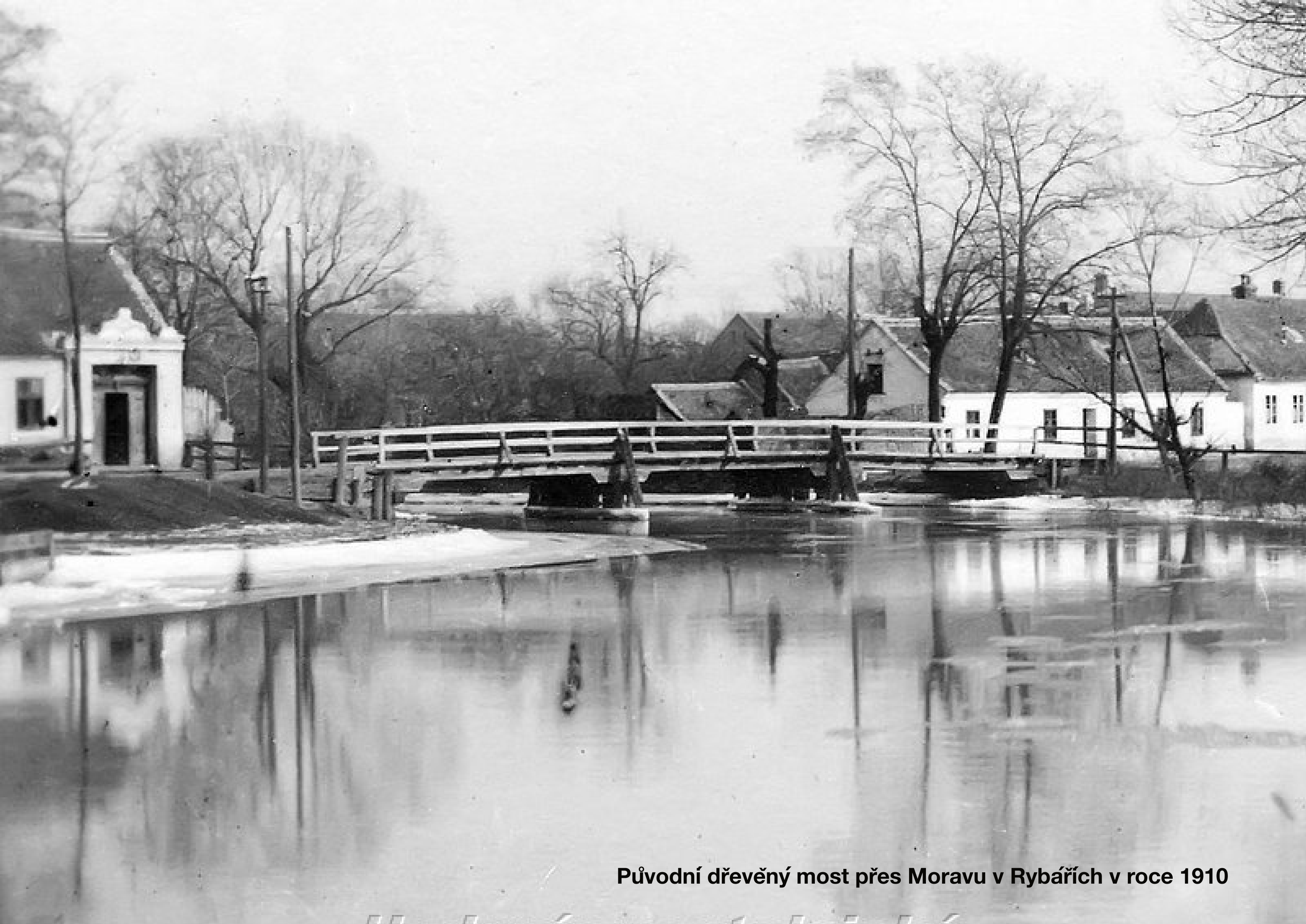
Původní dřevěný most přes Moravu v Rybářích v roce 1910