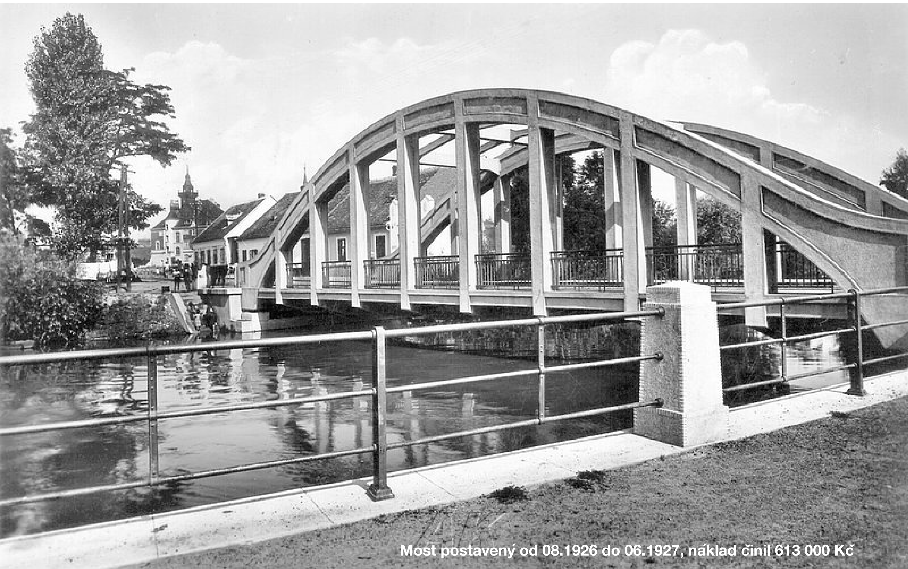
Most postavený od 08.1926 do 06.1927, náklad činil 613 000 Kč