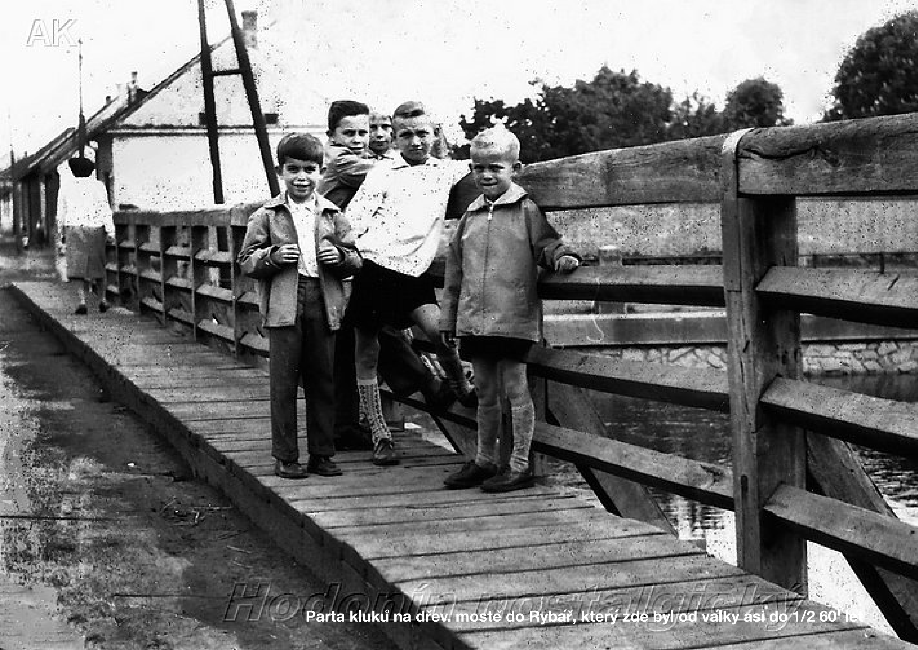
Hodonín Parta kluků na dřev. mostě do Rybář, který zde byl od války asi do 1/2 60' let