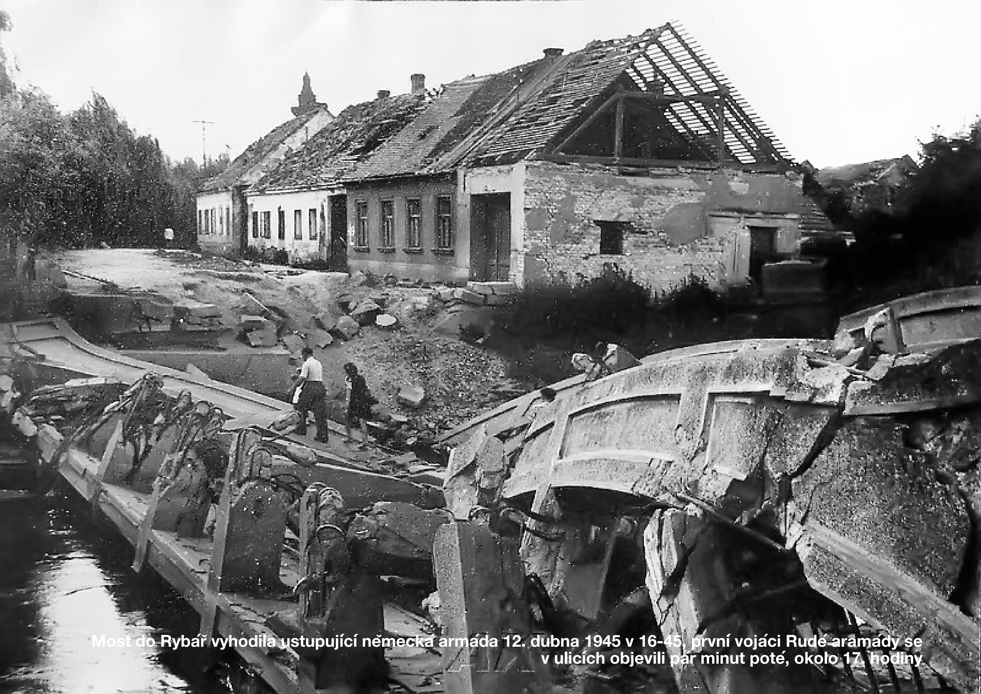
Most do Rybář vyhodila ustupující německá armáda 12. dubna 1945 v 16-45, první vojáci Rudé armády se v ulicích objevili pár minut poté, okolo 17. hodiny